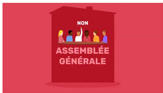
Copropriété : comment contester une décision d'Assemblée Générale