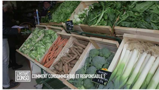
Comment consommer bio et responsable ?