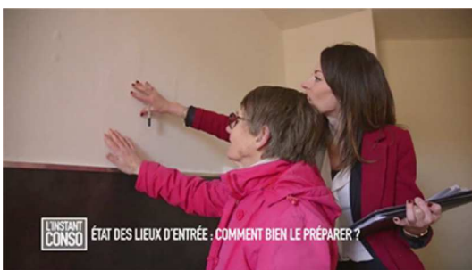
Etat des lieux d'entrée : comment bien le préparer ?