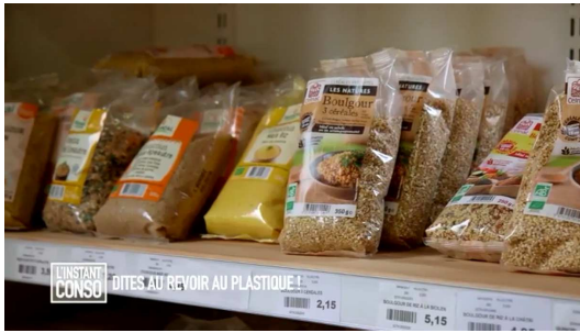
Dites au revoir au plastique !