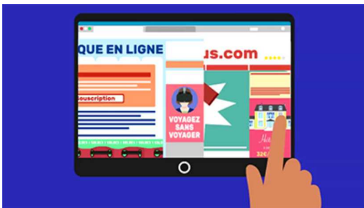
Comment bloquer les publicités sur Internet ?