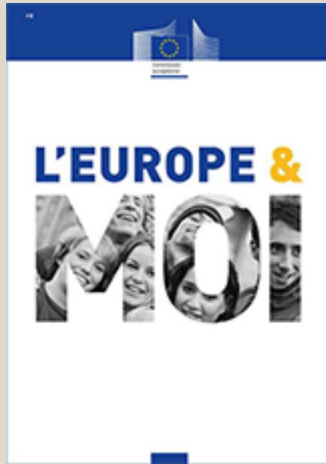
L'Europe et moi