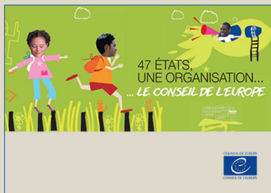
A la découverte de l'Europe des 47 du Conseil de l'Europe