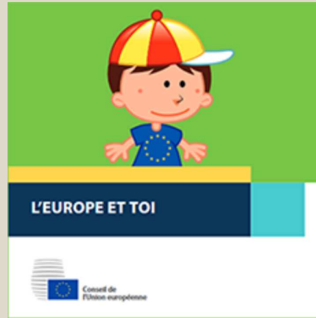
L'Europe et toi