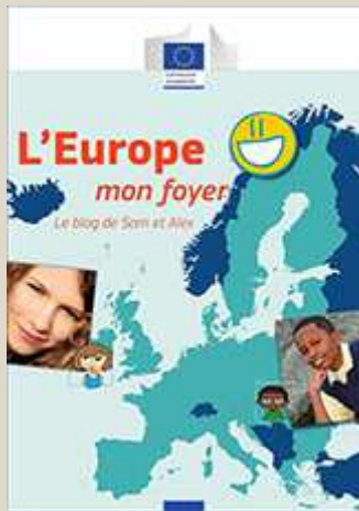
L'Europe mon foyer