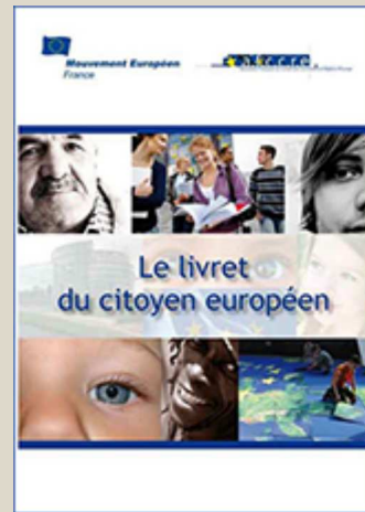
Le livret du citoyen européen