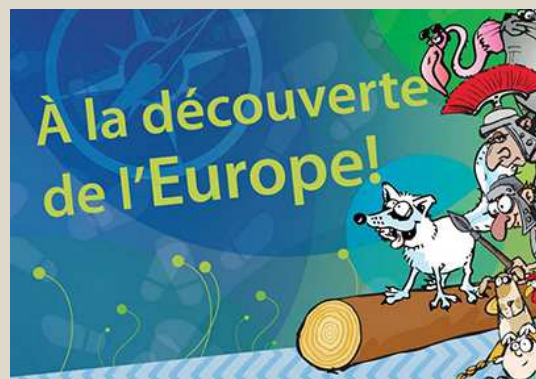
A la découverte de l'Europe !