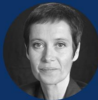
LAURENCE OLLIVIER INSTITUT NATIONAL DE LA CONSOMMATION 60 MILLIONS DE CONSOMMATEURS

Posez-leur toutes vos questions et participez le 9 mars à 18h en