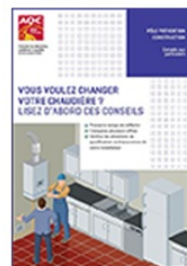
Vous allez changer votre chaudière

Fiches pratiques | Lettres types | Simulateurs | Associations de consommateurs