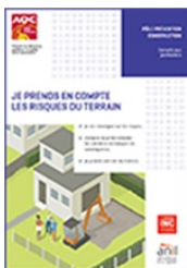
Je prends en compte les risques du terrain