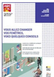
Vous allez changer vos fenêtres