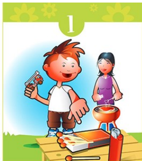
Cap'taine Prudence : on peut jouer ! Faut pas toucher !