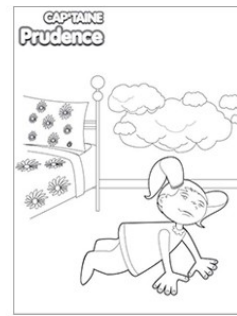
Cap'taine Prudence : à quatre pattes sous la fumée - Coloriage