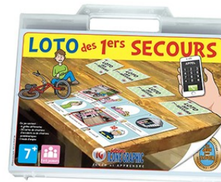
Le jeu : LOTO des 1ers secours