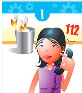
Cap'taine Prudence : nos amis les pompiers