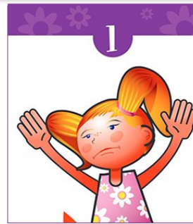
Cap'taine Prudence : arrête, tombe et roule