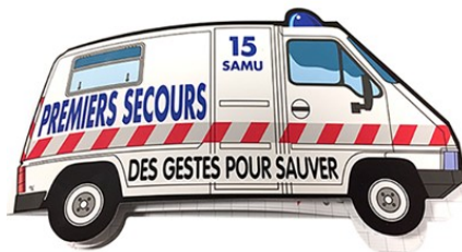
Le livret : Ambulance