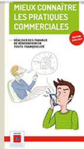
Règlementation : mieux connaître les pratiques commerciales