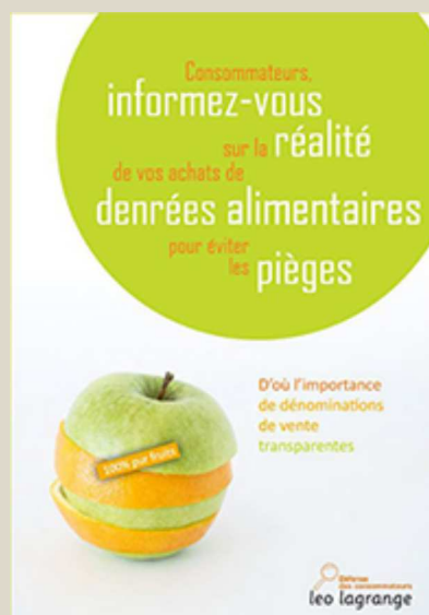
Consommateurs, informez-vous sur la réalité de vos achats de denrées alimentaire pour éviter les pièges