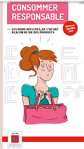
Achats : consommer responsable