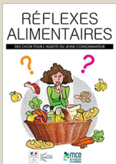
Réflexes alimentaire : des choix pour l'assiette du jeune consommateur