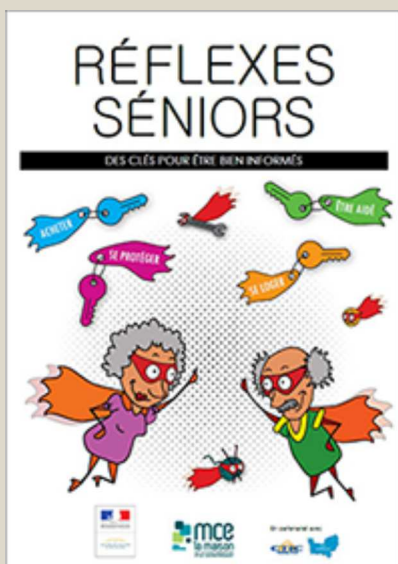
Réflexes séniors : des clés pour être bien informé mis à jour