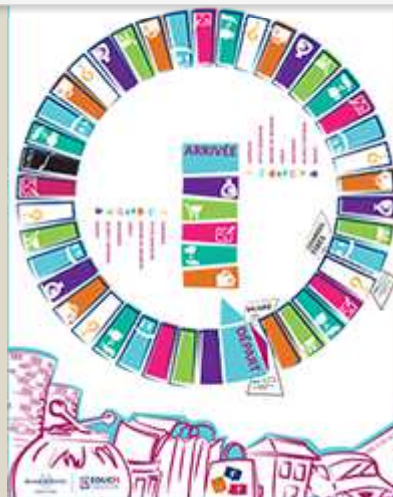
Mes questions d'argent - Le jeu